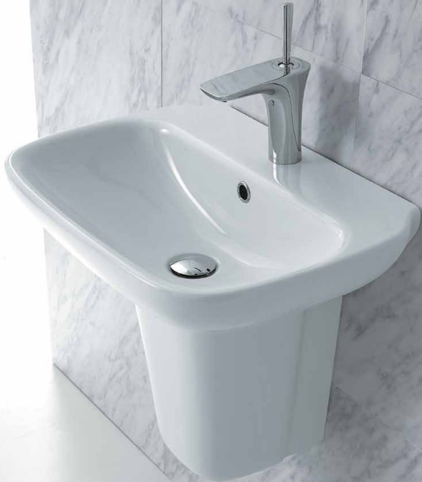
Lavabo cm 45 / Washbasin cm 45 art. 64CL Semicolonna / Semi Pedestal art. 16CL