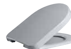
COPRIWATER termoidurente dispositivo soft close per NICOLE E CLEAR THERMOSETTING soft close system seat cover for NICOLE & CLEAR