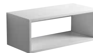
art. ZTOP90 Top sospeso cm90x43x35 Wall hung furniture cm90x43x35