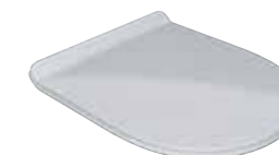
COPRIWATER SLIM termoidurente dispositivo Soft close per NICOLE E CLEAR SLIM THERMOSETTING soft close system seat Cover for NICOLE & CLEAR