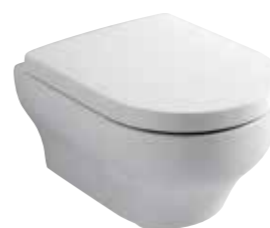
art. 15CL Wc sospeso cm50 Wall hung wc cm50