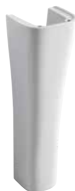
art. 10CL Colonna Pedestal

disponibili per - available for art.08CL / 09CL / 63CL / 64CL