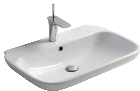
art. 08CL Lavabo monoforo cm75x45 Onehole washbasin cm75x45