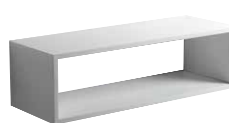
art. ZTOP120 Top sospeso cm120x43x35 Wall hung furniture cm120x43x35