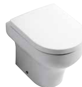
art. 03CL Wc terra cm50 Back to wall cm50