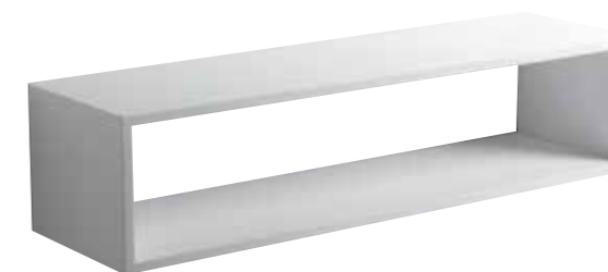
art. ZTOP150 Top sospeso cm150x43x35 Wall hung furniture cm150x43x35