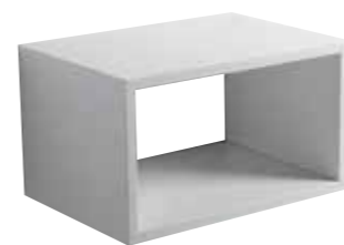
art. ZTOP60 Top sospeso cm60x43x35 Wall hung furniture cm60x43x35