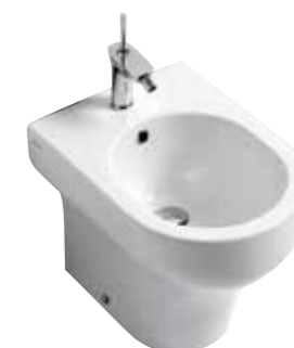
art. 05CL Bidet terra cm50 Back to wall bidet cm50