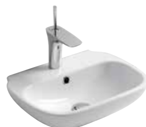
art. 64CL Lavabo monoforo cm45x35 Onehole washbasin cm45x35