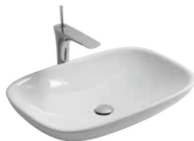
art. 31CL Lavabo d'appoggio cm66x44 Sit-on washbasin cm66x44