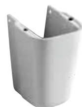
art. 16CL Semicolonna Semi-pedestal

disponibili per - available for art.08CL / 09CL / 63CL / 64CL