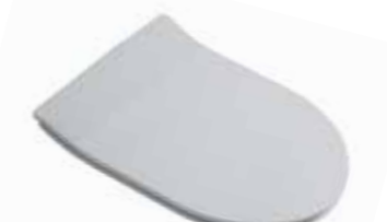
art. C9CL Copriwater "SLIM" soft close in termoidurente SLIM thermosetting soft close seat cover