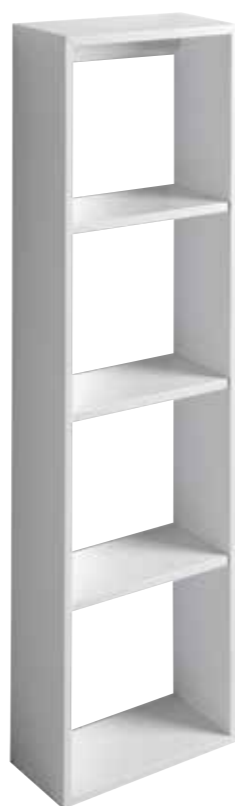
art. ZPEN45 Pensile sospeso cm150x45x20 Cabinet cm150x45x20