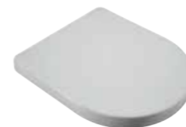
art. C6NI Copriwater in termoidurente Thermosetting seat cover