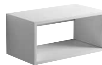
art. ZTOP75 Top sospeso cm75x43x35 Wall hung furniture cm75x43x35