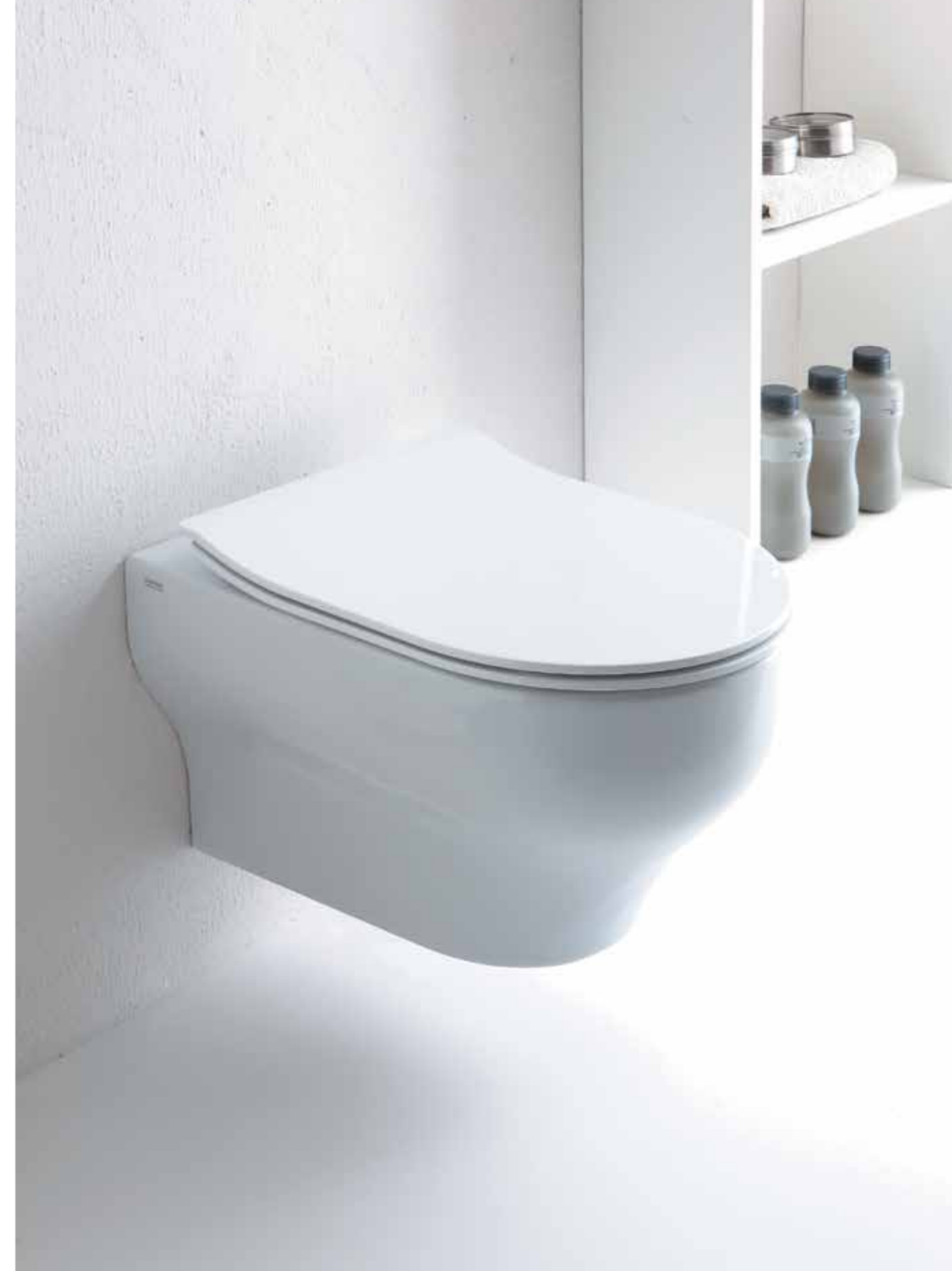
Wc sospeso / Wall hung wc art.15CL Bidet sospeso / Wall hung bidet art.17CL