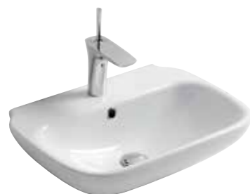
art. 63CL Lavabo monoforo cm55x40 Onehole washbasin cm55x40