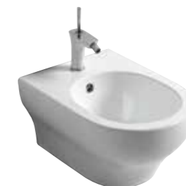
art. 17CL Bidet sospeso cm50 Wall hung bidet cm50