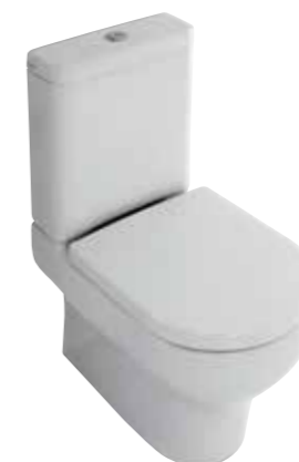
art. 04CL / 12CL Wc monoblocco btw cm62 Wc pan cm62 Cassetta monoblocco Cistern for pan