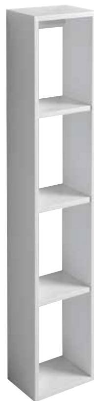
art. ZPEN30 Pensile sospeso cm150x30x20 Cabinet cm150x30x20