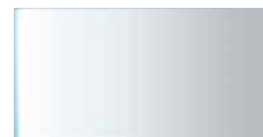
art. SPI75 Specchio cm75x50 Mirror cm75x50