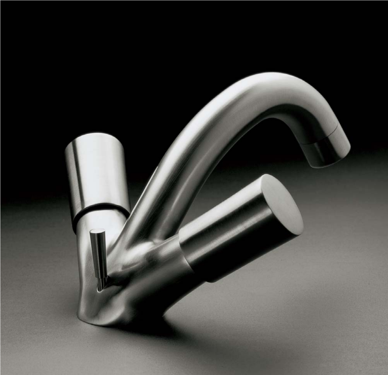
90AS Lavabo / Wash basin