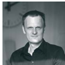
Design Studio RKDO Hans Thyge Raunkjaer, Denmark. Studio RKDO works with a variety of household objects, furniture and interior design for clients worldwide. www.rkdo.dk

Ono is the living-proof of pure Scandinavian design. It is at the same time straight and sophisticated, simple and complex. Without any superficial detail, only pure essence, pure tap. Ono is a design bathroom fitting, whose line of accessories offers the ideal solution for both interior and external settings. Ono is a stainless steel AISI304 made faucet. It is produced through a high tech micro-casting process which guarantees its quality and performance.