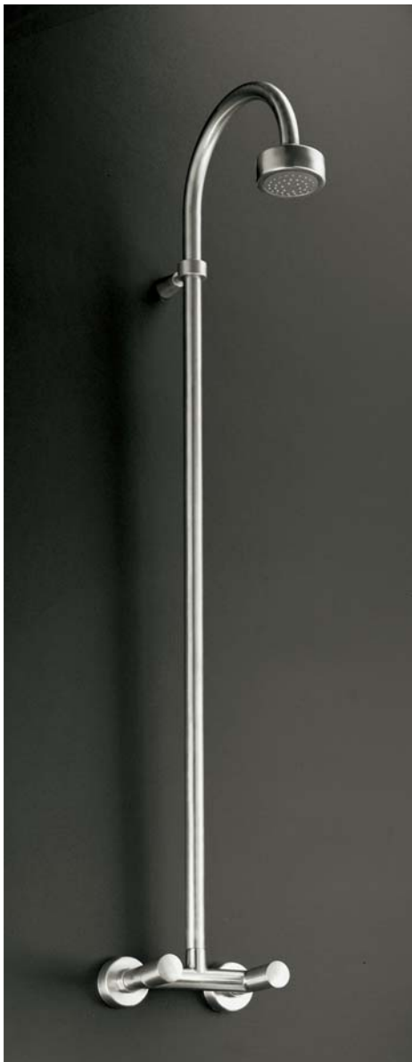
9314AS Gruppo doccia esterno con soffione / Wall-mounted shower tap with headshower.