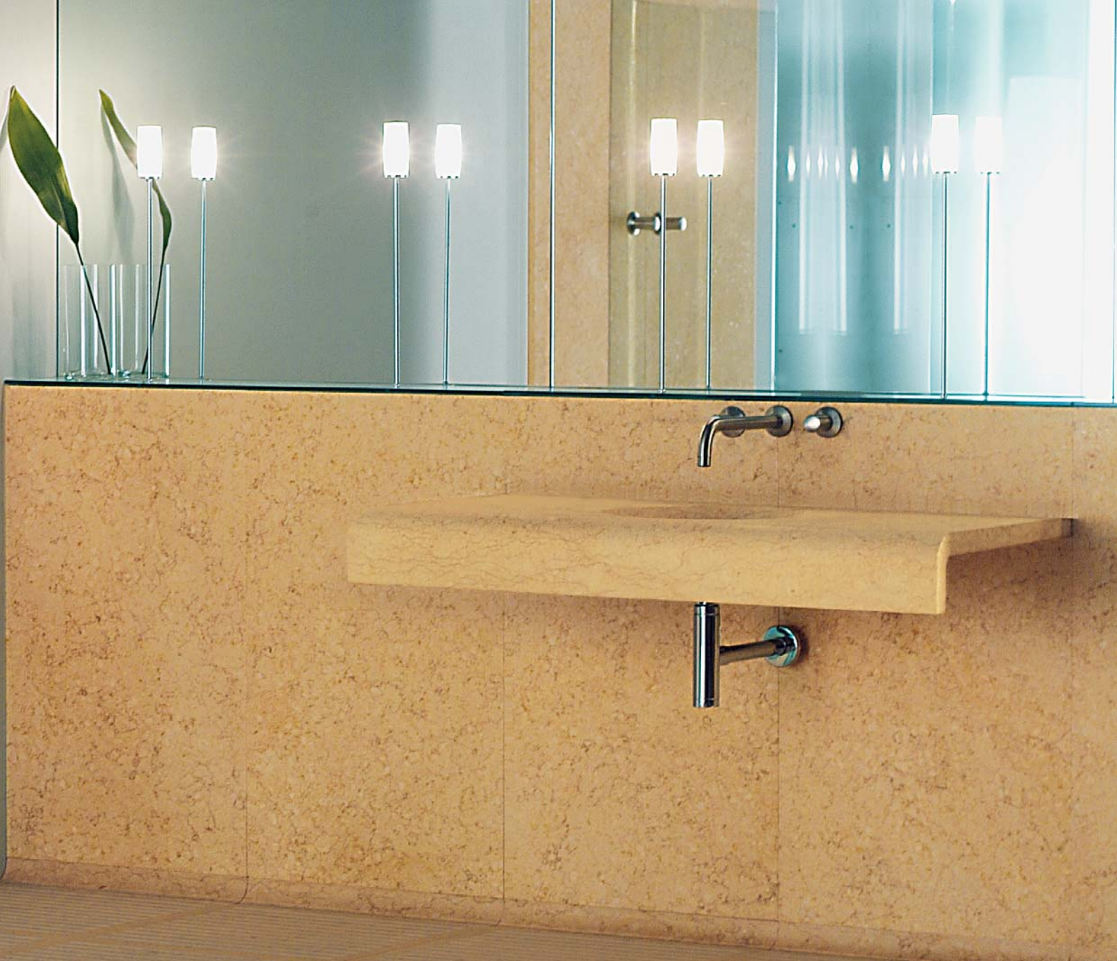
151AS Lavabo incasso a muro / Concealed wash basin tap