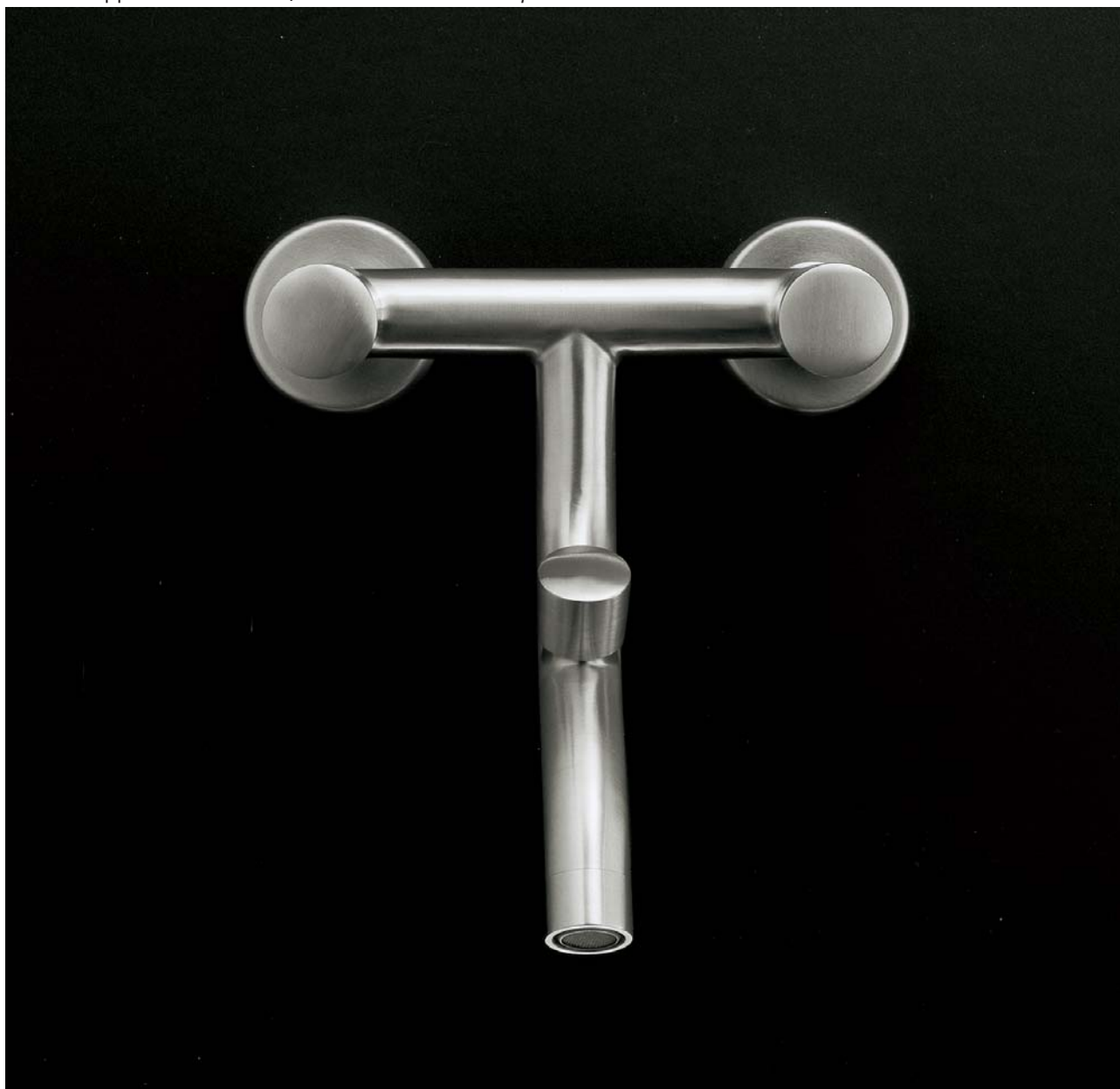
92AS Gruppo vasca esterno / Wall-mounted bath tap