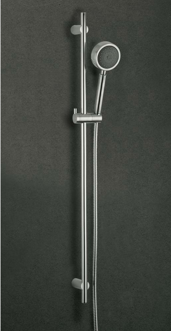
19AS Kit saliscendi in acciaio con doccetta in acciaio inossidabile / Stainless steel sliding rail set with stainless steel handshower